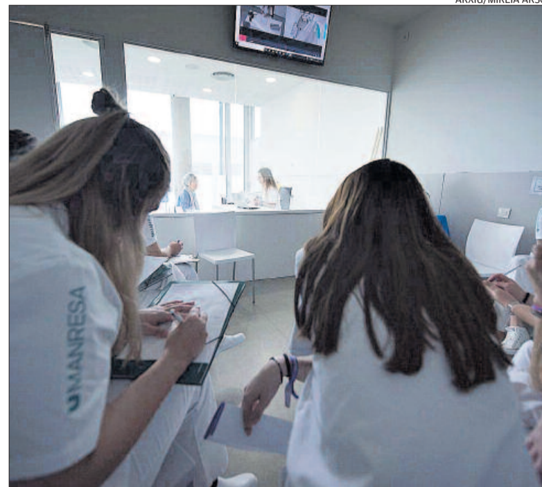
Estudiants d'Infermeria en una classe de simulació, a la FUB-UManresa

La humanitat és el principal valor de la professió que han destacat les infermeres i infermers entrevistats per Regió7 que treballen a diferents centres sanitaris i assistencials, des d'hospitals fins a atenció primària o bé a residències. Tots destaquen que, davant un fet inesperat i desconegut com la pandèmia de la Covid, els professionals d'infermeria han desenvolupat una tasca que ha anat més enllà de prestar atenció sanitària. Sovint han fet d'enllaç entre malalt i família o senzillament acompanyament en moments durs.