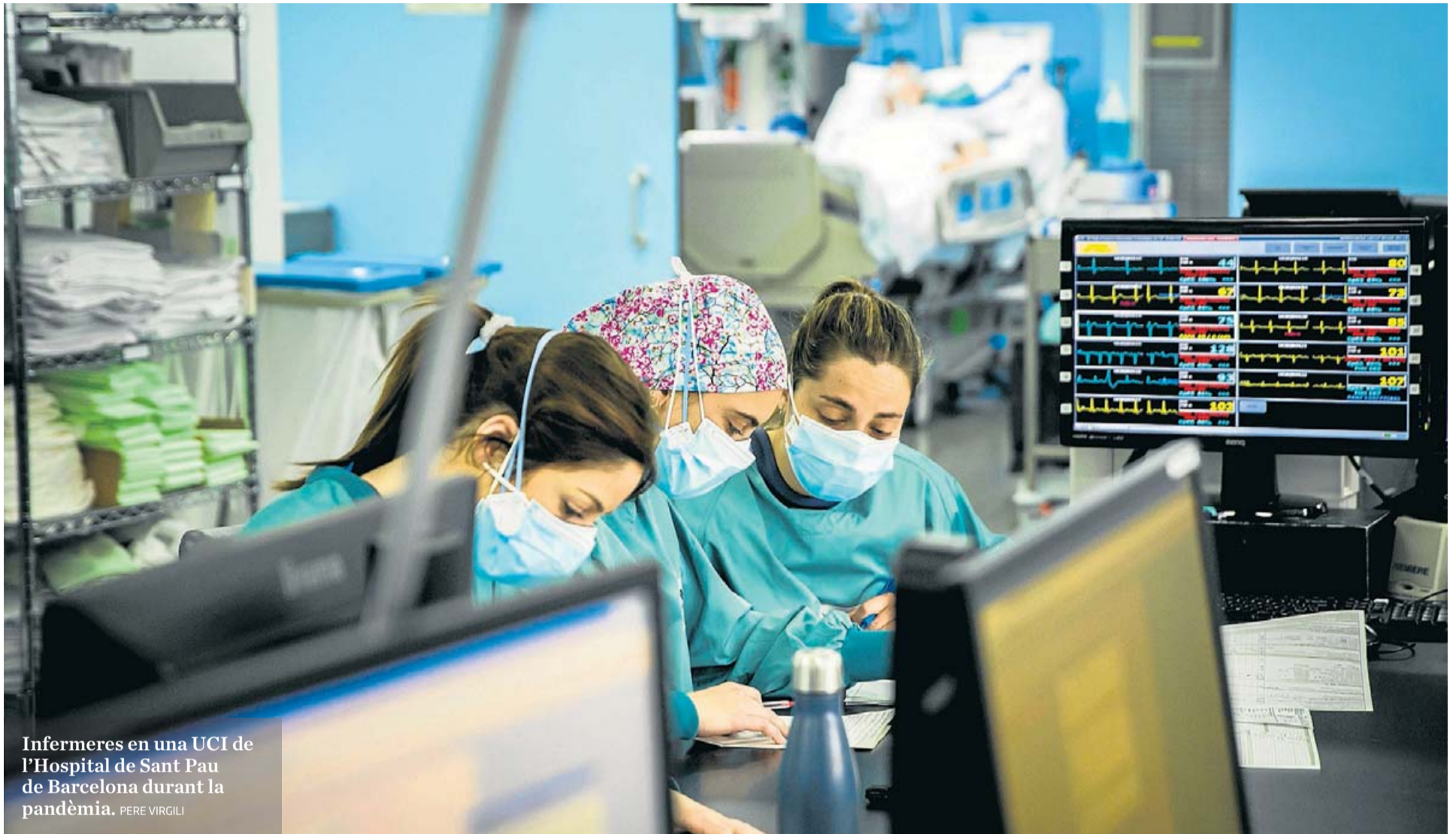
Infermeres en una UCI de l'Hospital de Sant Pau de Barcelona durant la pandèmia. PERE VIRGILI